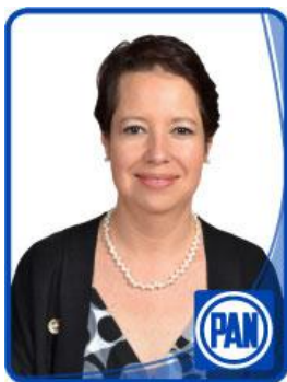
Dip. Adriana de Lourdes Hinojosa Céspedes.

Con sustento en lo dispuesto por los artículos 116 de la Constitución Política de los Estados Unidos Mexicanos; 51 fracción II y 61 fracción I de la Constitución Política del Estado Libre y Soberano de México; 30, 38 fracción IV de la Ley Orgánica del Poder Legislativo del Estado Libre y Soberano de México; 72 fracción I, 108 del Reglamento del Poder Legislativo del Estado Libre y Soberano de México, en mi carácter de diputado local y a nombre del Grupo Parlamentario del Partido Acción Nacional, formulo la presente iniciativa de: