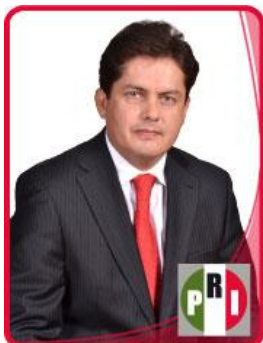
Dip. Jesús Ricardo Enríquez Fuentes.

Con fundamento en lo dispuesto en los artículos 51 fracción II y 64 fracción I de la Constitución Política del Estado Libre y Soberano de México, y 28 fracción I de la Ley Orgánica del Poder Legislativo del Estado Libre y Soberano de México, los integrantes de la Diputación Permanente, nos permitimos presentar a este órgano de la Legislatura, iniciativa de decreto por el que se convoca, a la "LVIII" Legislatura del Estado de México, a la celebración del Noveno Período Extraordinario de Sesiones, conforme la siguiente: